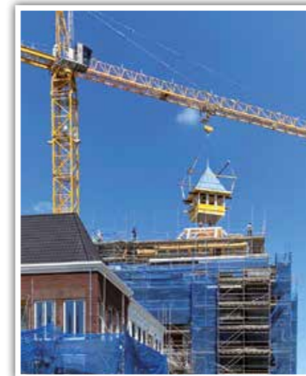
Deze toren is door onze prefab afdeling gefabriceerd

"We produceren voor particulieren, ondernemers en zelfs andere aannemers"